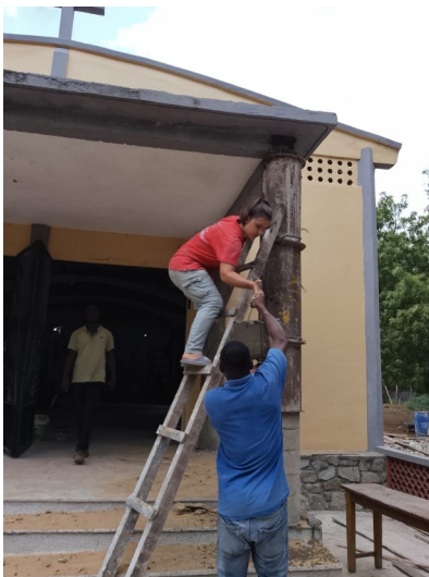
Eingang der Kirche von Pya