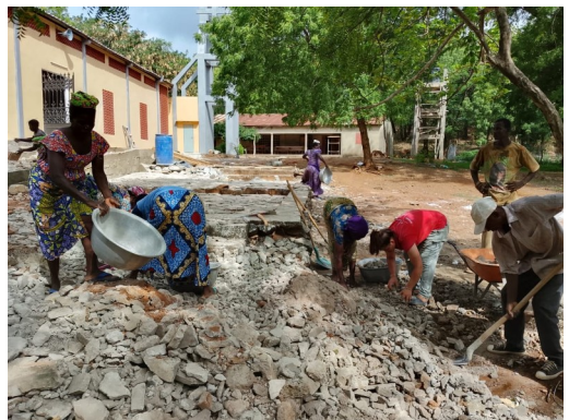
Kirchplatz in Pya