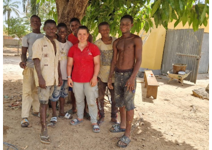
„Meine Maler-Gruppe“ – die Jugendlichen der Gemeinde von Défalé

Die Summe für ein entsprechendes Fahrzeug beträgt umgerechnet um die 7000 €. Ein kleiner Teil wurde bereits in der Gemeinde hier gesammelt.