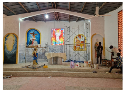
Altarraum der Kirche von Pya (rechts wird der Hl. Joseph gemalt)