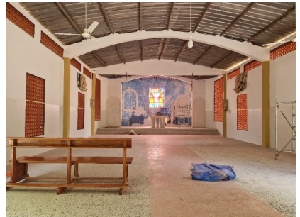
Bauarbeiten in der Kirche "Christ-König" von Pya